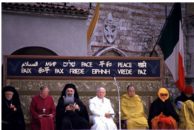
les rencontres d'Assise, 27 octobre 1986, sous le pontificat de saint Jean-Paul II

Le dialogue interreligieux peut être vu comme inintéressant par une partie de la population, peu important leurs croyances. L'histoire moderne du dialogue interreligieux n'est pas très riche, en effet elle remonte